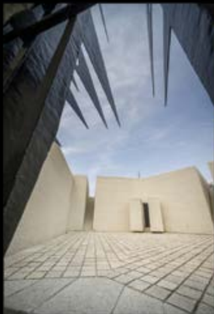
MÉMORIAL DES MARTYRS DE LA DÉPORTATION

DES HAUTS LIEUX DE LA MÉMOIRE NATIONALE EN ÎLE-DE-FRANCE