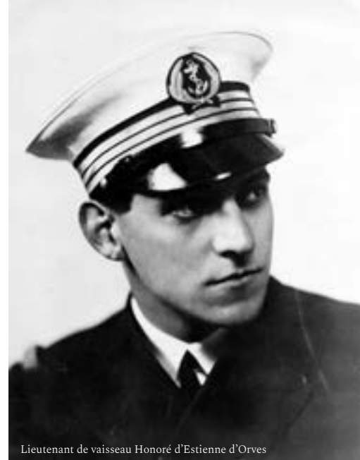
Lieutenant de vaisseau Honoré d'Estienne d'Orves

Après avoir approché le langage caractéristique de la bande-dessinée, les apprentis dessinateurs réaliseront leur propre BD et retraceront le parcours du résistant Honoré d'Estienne d'Orves. Répondant à l'Appel du général de Gaulle, cet officier de la Marine organisa le réseau de renseignements appelé « Nemrod ». Fusillé le 29 août 1941 pour ces activités clandestines, Honoré d'Estienne d'Orves incarne aujourd'hui l'une des grandes figures de la Résistance. À l'aide de documents d'archives et d'exemples de bandes dessinées, les enfants écriront et dessineront sur quelques planches, l'histoire de ce résistant en BD.