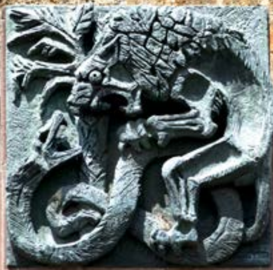
Haut-relief « Le Fezzan » par Aimé Bizette-Lindet