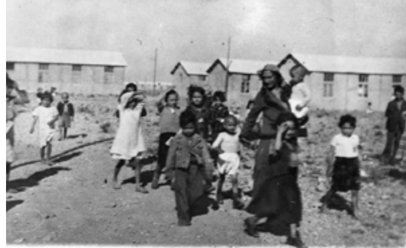
Internement de tsiganes au camp de Rivesaltes

En partenariat avec la mairie de Paris et le mémorial de la Shoah