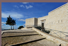
Mémorial du débarquement et de la libération de Provence

Avenue du Professeur- Léon-Bernard 92 150 Suresnes