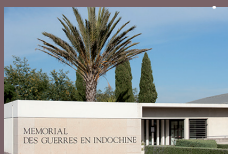
Mémorial des guerres en Indochine

Route Départementale 130 67 130 Natzwiller