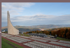
Struthof Site de l'ancien camp de Natzweiler - Centre européen du résistant déporté

Route Départementale 130 67 130 Natzwiller