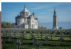
Nécropole nationale de Notre-Dame de Lorette

L'ONACVG est l'un des opérateurs incontournables de mémoire de l'Etat présent sur l'ensemble du territoire grâce à ses services de proximité.