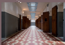
Mémorial national de la prison de Montluc

Route Nationale 7 Route du Général Calliès 83 600 Fréjus