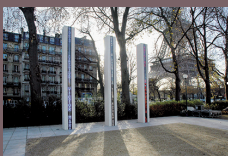
Mémorial national de la guerre d'Algérie et des combats du Maroc et de la Tunisie