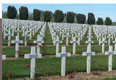
Nécropole nationale de Fleury-devant-Douaumont